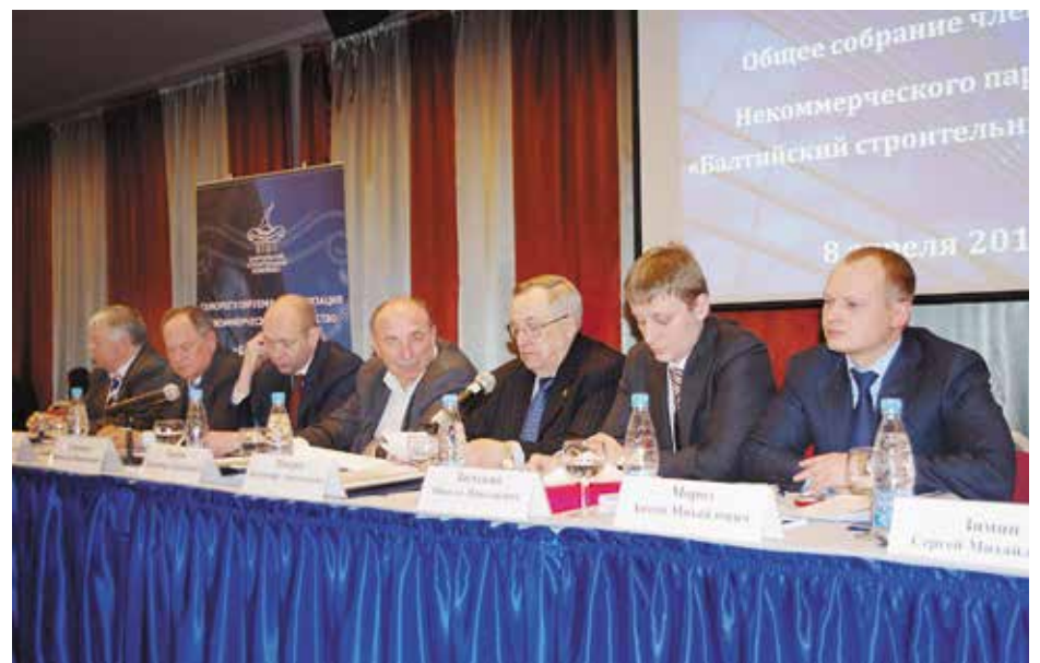
Общее собрание членов Ассоциации СРО «БСК»