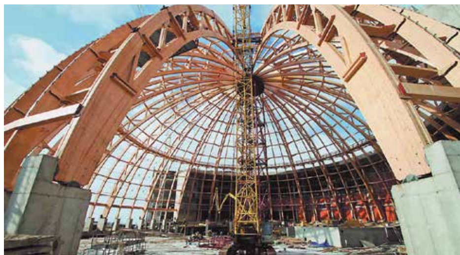
Строительство аквапарка «Питерлэнд» в Санкт-Петербурге

(в т.ч. крупнейший завод по ремонту атомных подводных лодок «Нерпа»), причалы в Баренцевом и Белом морях, объекты соцкультбыта и многое другое.