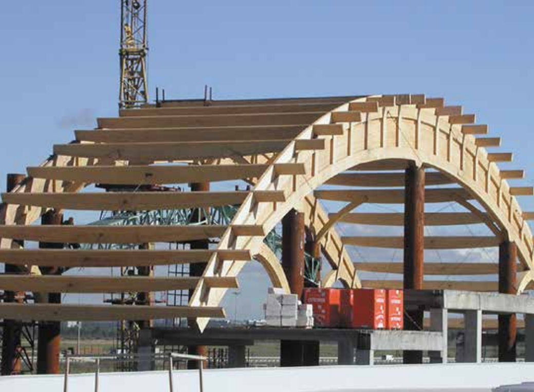
Торговый комплекс в пос. Бугры Ленинградской области