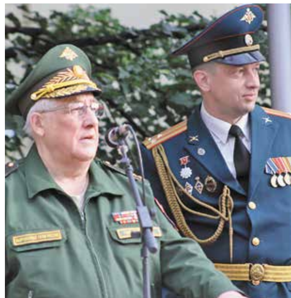
Присяга в ВИТУ. 2017 г.